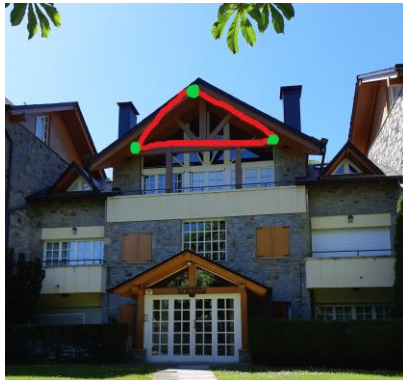
Figura: Triangle, 3 costats, 3 vèrtexs.