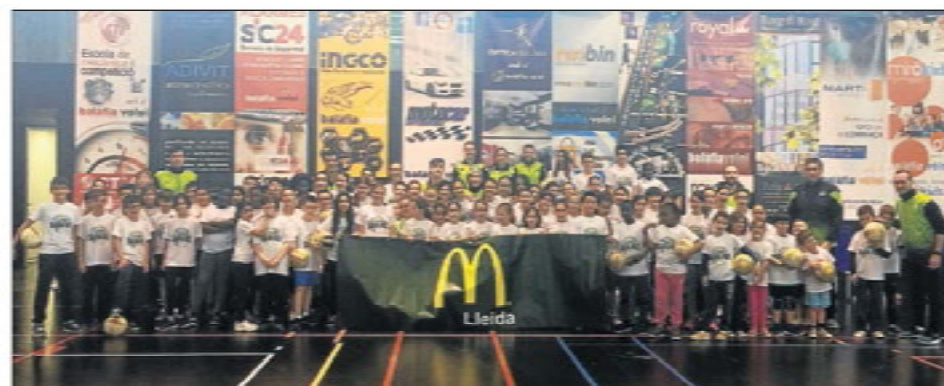
Prop de 90 nens van participar, ahir, en la segona edició de la Trobada Voleibolitzat organitzada pel club.