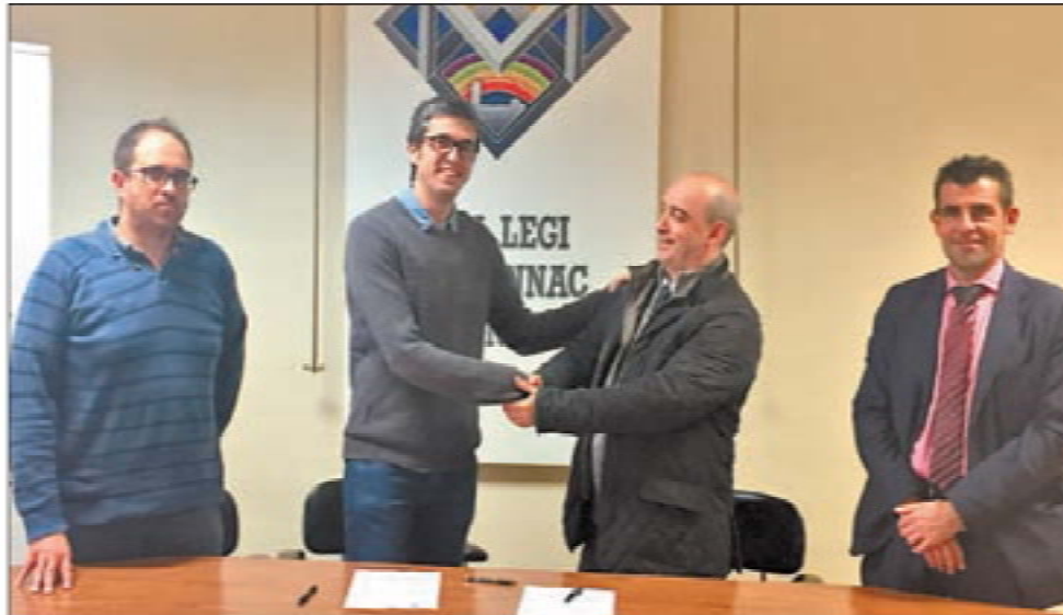
El club renovó su colaboración con el colegio Lestonnac