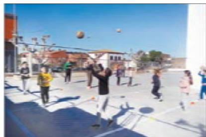
La iniciativa del club saltó por primera vez de la capital

El 'Voleibolitza't' del Balàfia Vòlei llega por primera vez a Sudanell y Montoliu