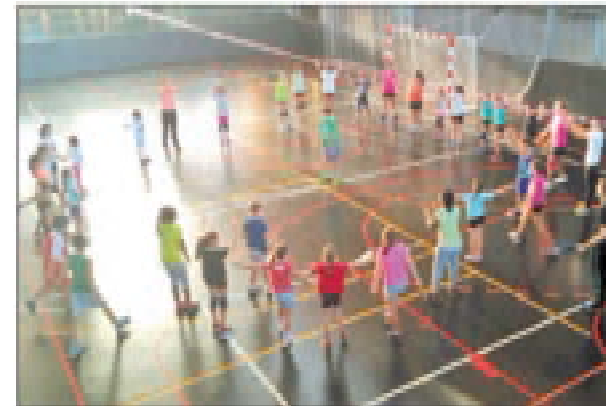
Un entrenamiento en el Juanjo Garra

voleibol tanto en las escuelas como en el pabellón Juanjo Garra ha dado sus frutos y ha servido para atraer a mucha juventud que se quiere iniciar en este deporte. En este sentido, cabe destacar que el número de niños y niñas de la escuela se ha visto triplicado respecto a la temporada pasada, lo que permitirá hacer numerosos equipos en categoría alevín y, por tanto, enriquecer la competición escolar. Además, por primera vez el Balàfia Volei hará un equipo prebenjamín. El éxito del programa Voleibolitzat garantiza su continuidad este curso.