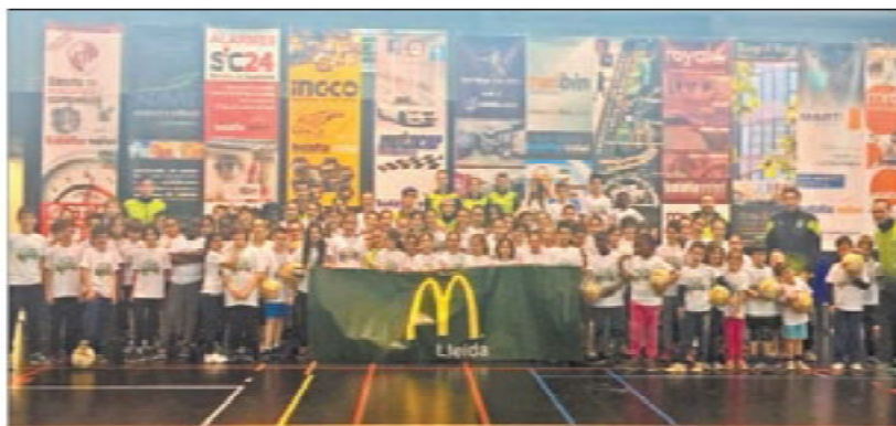
La segunda jornada del "Voleibolitzat" reunió a 90 niños y niñas en el Juanjo Garra

El Vikings Volei Prat se presentó en Lleida con siete jugadores, sus siete jugadores titulares, y pese a que los leridanos podrían haber aprovechando esta circunstancia para plantear un partido físico y poder castigar a su rival por la vía del cansancio, lo cierto es que el conjunto visitante ni tan siquiera permitió que se dieran las condiciones para ello,