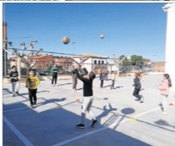
Nens de Montoliu durant l'activitat 'Voleibolitza't'.