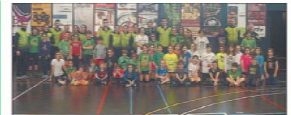
Los participantes en la iniciativa ayer en el pabellón Juanjo Garra de Lleida