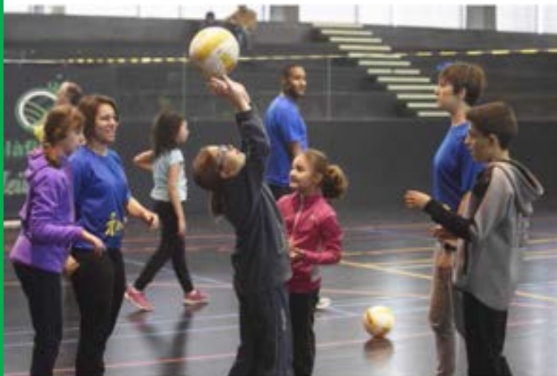
ACOMPANYAMENT. L'equip Pibody (vestits de blau) interacciona per a la inclusió.

Les estades esportives de Pibody també serveixen per promoure el respecte a la diversitat de ritmes i la sensibilització social.