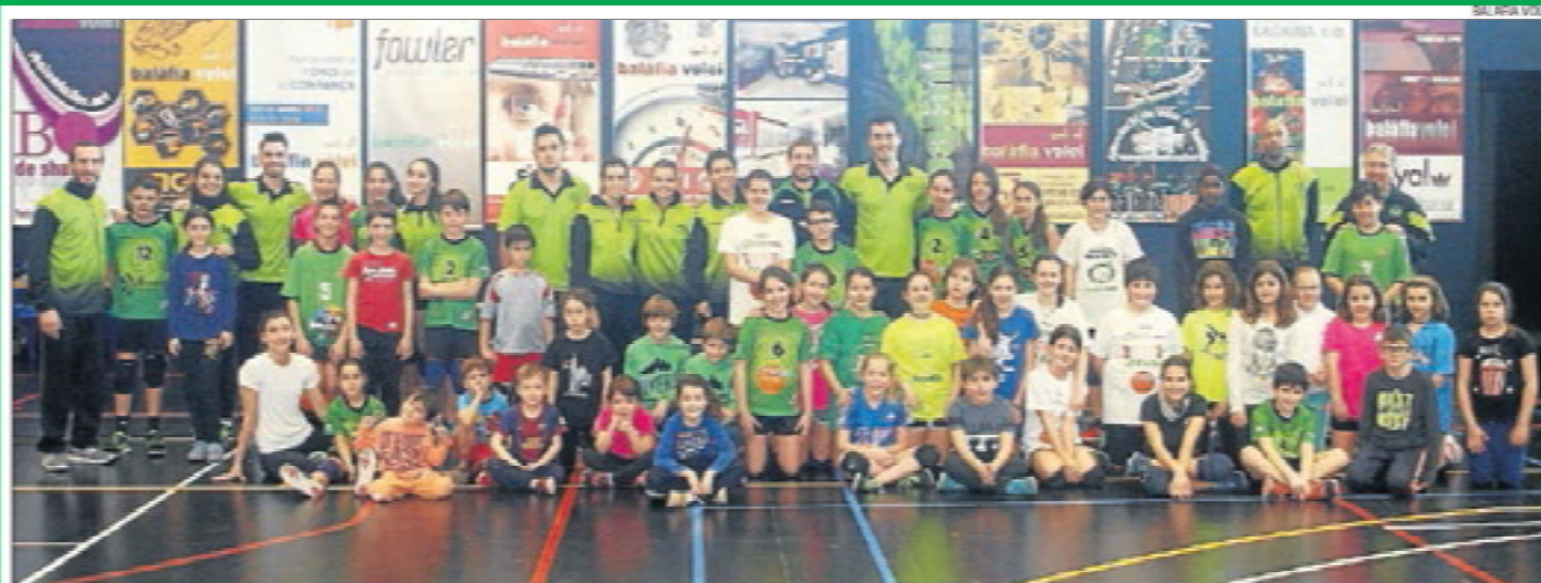
Primera Trobada Voleibolitzat. Més de 40 nens i nenes de diferents col·legis de Lleida, com Lestonnac, Pràctiques I, Claver, Mirasan i Paisos Catalans, entre d'altres, van prendre part ahir en la primera jornada que organitza el Balàfia Vòlei per captar nous jugadors per al seu planter.