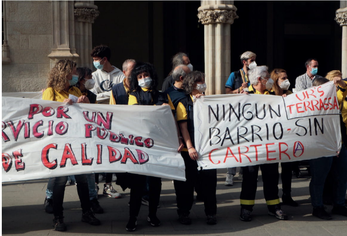
■ Concentració de carters i carteres al Raval el passat 31 de maig.

El col·lectiu de treballadors de Terrassa s'ha organitzat i ha dut a terme fins al moment un dia de vaga. Demanen més contractacions estables en una plantilla sobrecarregada i per poder oferir un millor servei públic.