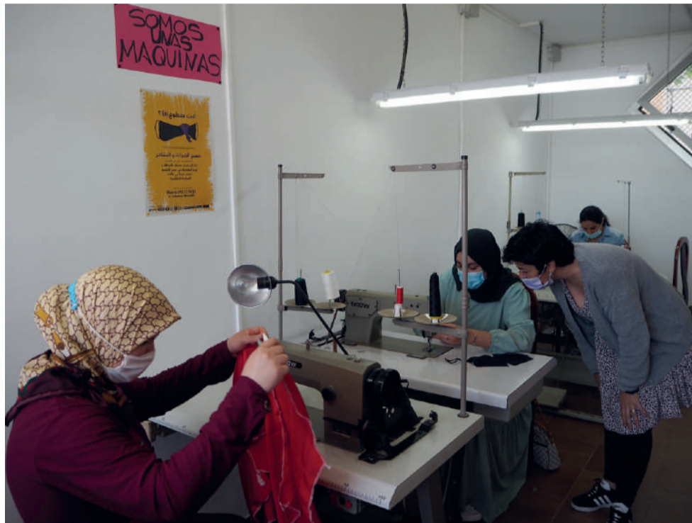
■ Dones magribines cosint al taller tèxtil del barri de Montserrat