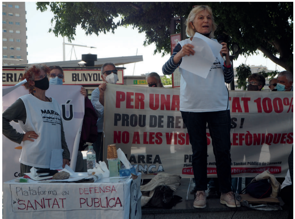
La Plataforma en Defensa de la Sanitat Pública-Marea Blanca va presentar públicament la seva campanya per què el servei que presta Mútua Terrassa sigui públic al 100%.