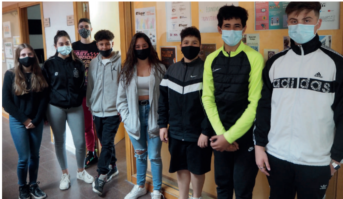
■ Grup de joves de 3r d'ESO de l'IES Ègara que han participat en un projecte de servei comunitari amb Malarrassa

El projecte i propostes imaginats, de totes maneres, van esdevenir inabastables en el context de la pandèmia. «Quan vam començar vam anar veient que això seria més lent, però vam decidir anar endavant igualment, encetar una proposta que pogués tenir continuïtat». Tot plegat va esdevenir un