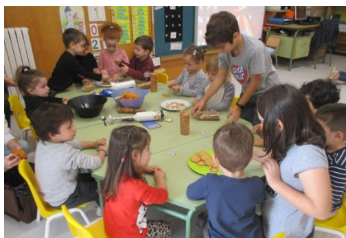
3r explica la recepta als alumnes d'educació infantil.

Aquests espais de relació són fonamentals per a promoure una bona convivència i cohesió social entre l'alumnat. A més a més de celebrar festes catalanes, el que es fa és significatiu i motivador per l'alumnat.