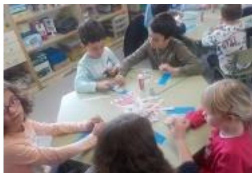
Sant Jordi s'ajunten P5-5è, 3r-P3, 4rt-P4 (que seran els futurs padrins i fillols quan facin 1r i 6è respectivament) i 6è-1r i 2n