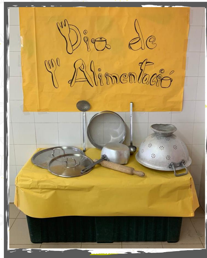
Els nostres equips preparen l'activitat amb molta il·lusió