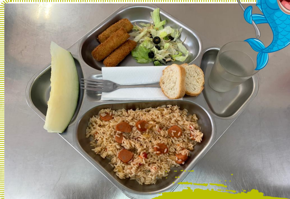
Arròs milanesa de mar Filet de lluç arrebossat amb amanida fruita