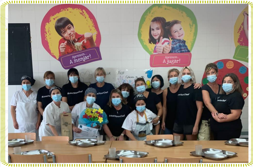
Reconeixement al nostre xef de l'escola