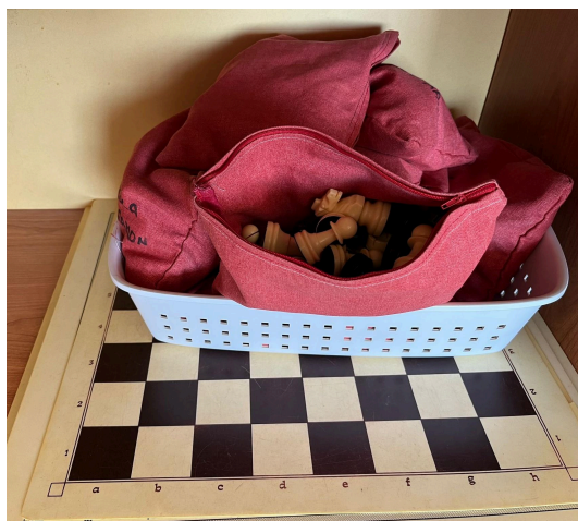
Racó del material d'escacs a l'aula

L'aula on s'imparteixen les sessions d'escacs és la mateixa aula on els alumnes fan la resta d'àrees, i cadascun dels cicles disposen del material necessari perquè els alumnes puguin jugar-hi, d'aquesta manera, quan tenen escacs, poden recollir els taulers i peces del seu cicle i portar-ho a la classe.