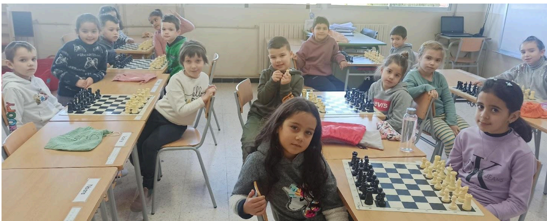
Alumnat de 1r de primària en sessió d'escacs

Els escacs s'han introduït dins l'àmbit curricular d'educació primària, i dins de l'horari lectiu.