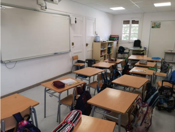
AULA DE PRIMÀRIA