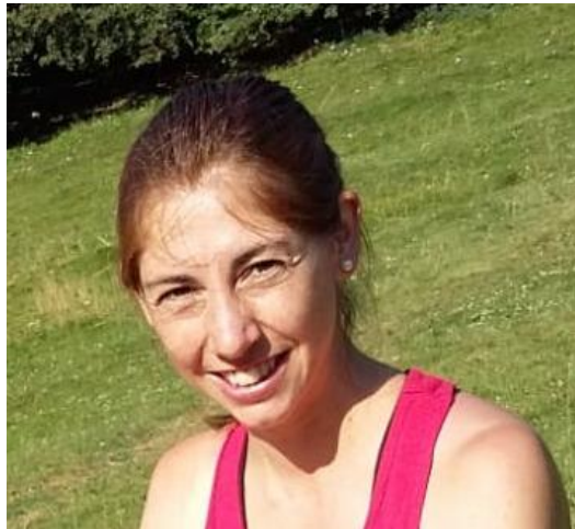
MERITXELL SUPORT I MÚSICA