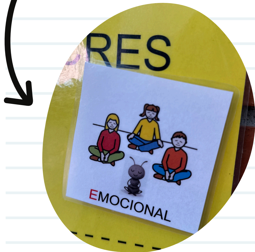
PICTOGRAMA A L'HORARI