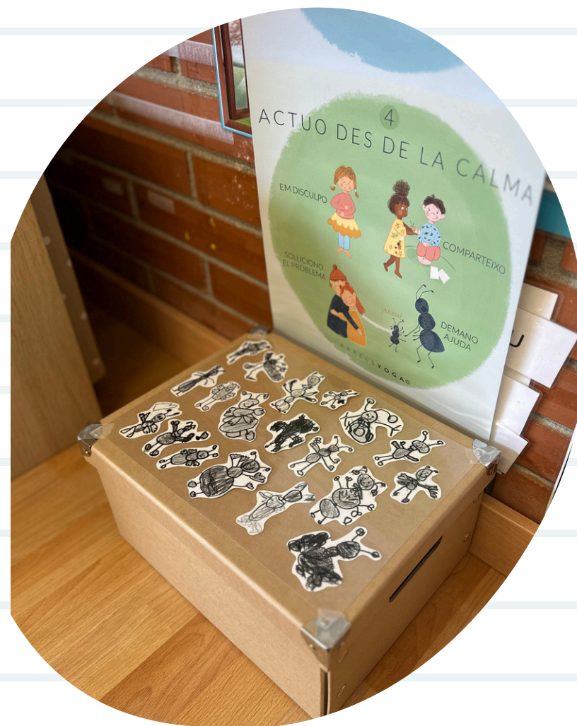
CAPSETA DE LA FORMIGUETA