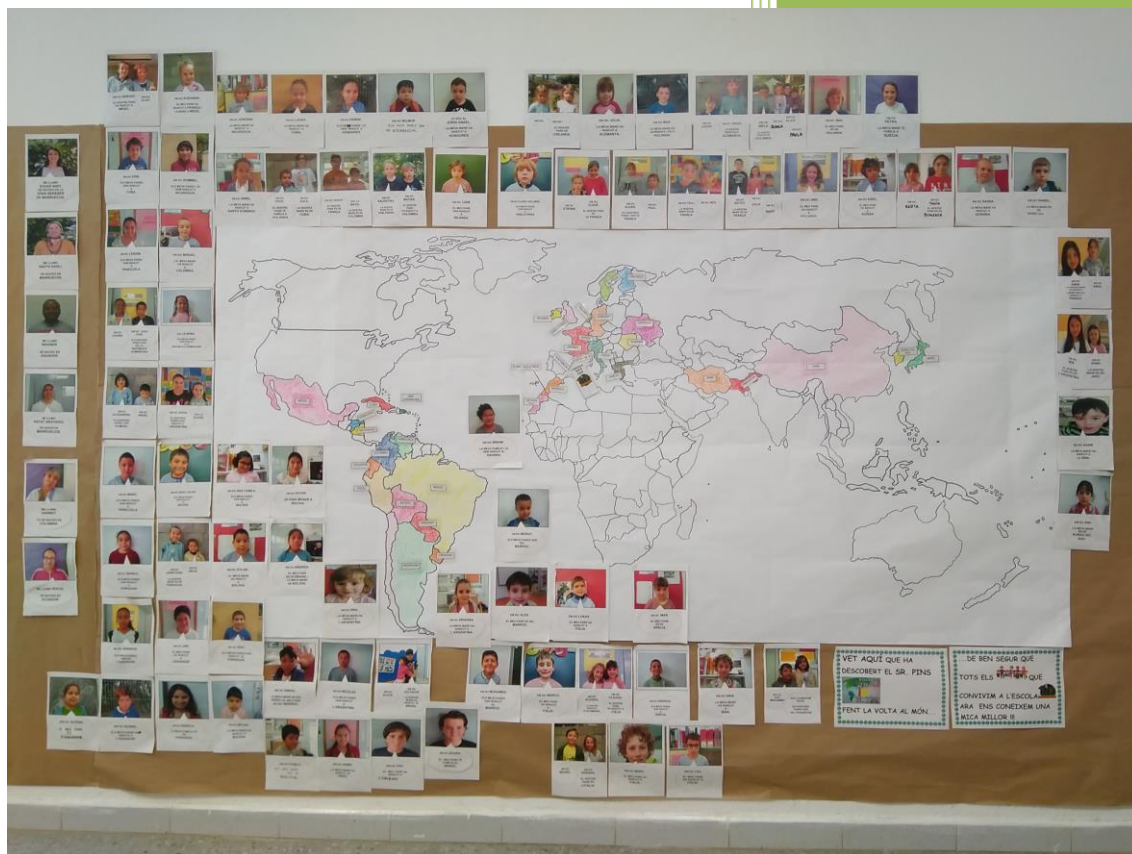
"Mural països de procedència de les famílies dels alumnes"