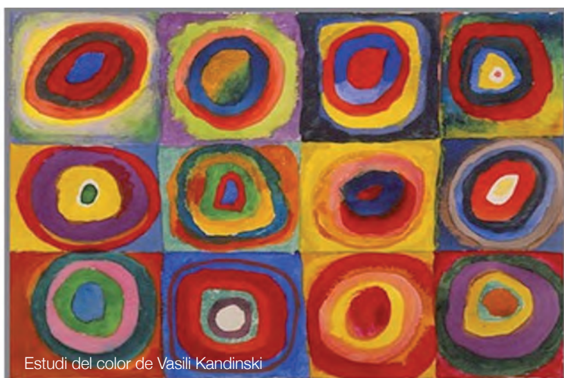
Estudi del color de Vasili Kandinski

El que veiem ho facilita la vista i el que interpretem conforma la nostra visió.