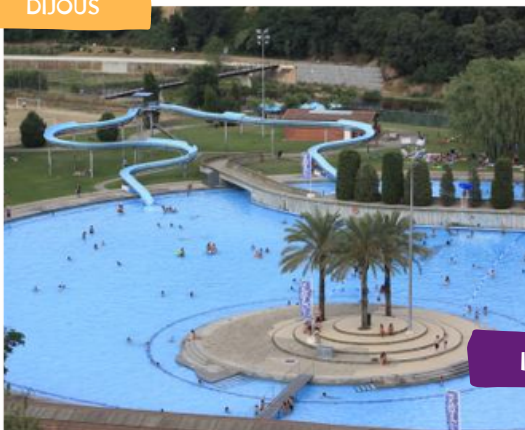
BASSA DE SANT OLEGUER