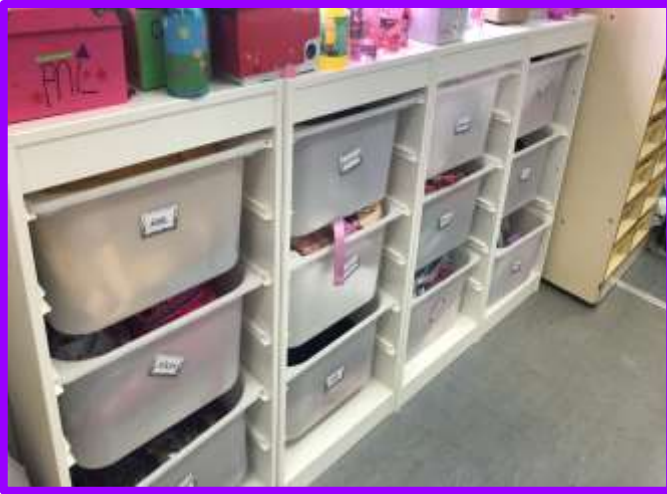
Motxilles i jaquetes als calaixos