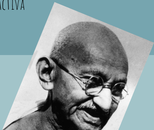
FIGURA CENTRAL DEL MOVIMENT D'INDEPENDÈNCIA INDI I PER ADVOCAR PER LA NO-VIOLÈNCIA ACTIVA