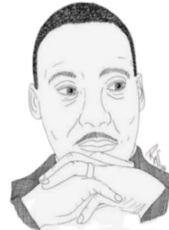
MARTIN LUTHER KING