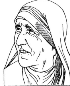
TERESA DE CALCUTA