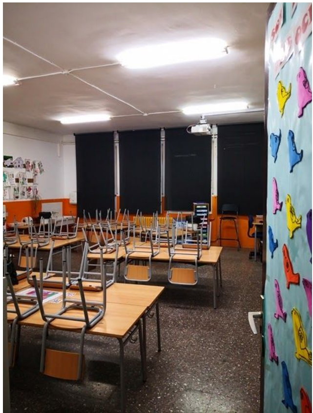
1rA Classe dels ocells

La devolució dels deures la podeu fer a través del correu 12inicial@gmail.com Si no podeu enviar els deures per correu podreu entregar-los quan tornem a l'escola.