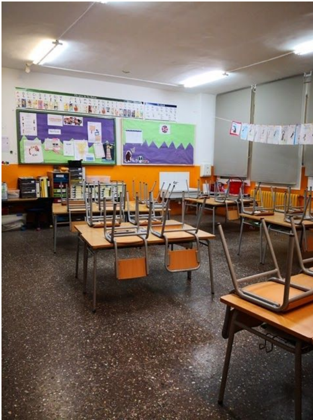
1rB Classe del mar

LES MESTRES TREBALLEM JUNTES PER CONTINUAR TREBALLANT AMB VOSALTRES.