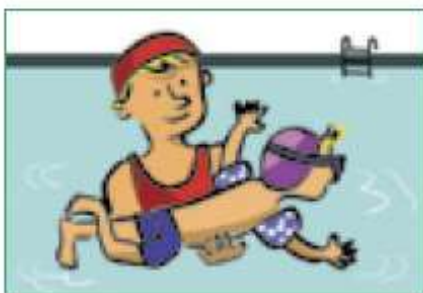
Com a persones.

Escriu a sota de cadascuna de les escenes representades com ens educa la família.