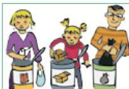
En el respecte per l'entorn.