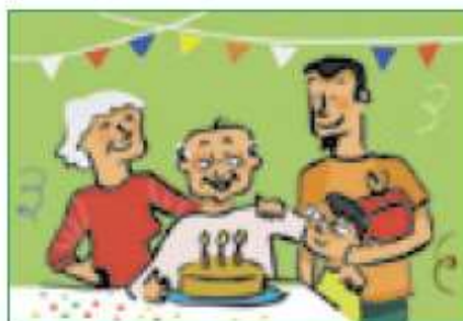
En les relacions humanes.