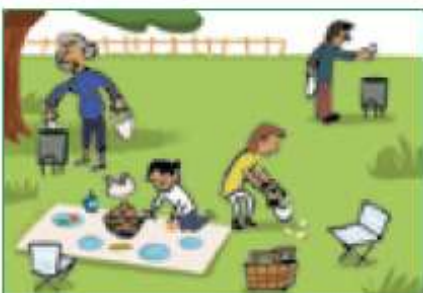
En el respecte per l'entorn.