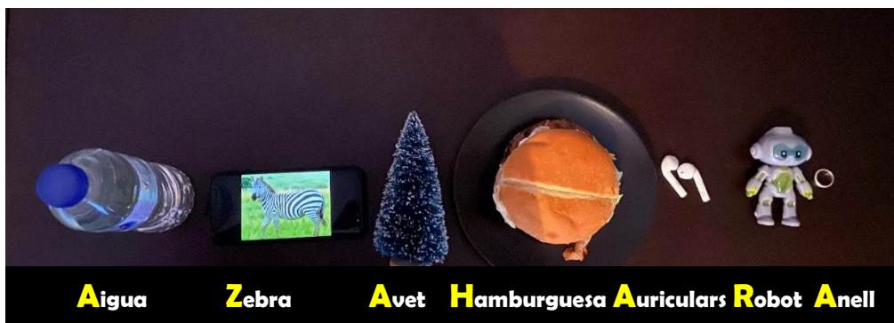
A igua Z ebra A vet H amburguesa A uriculars R obot A nell