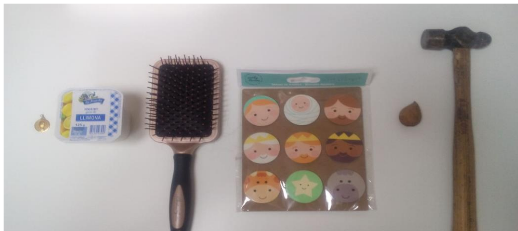
M edalla I ogurt R aspall I nants A metlla M artell