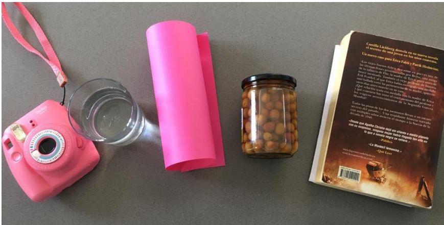
C àmera A igua R osa O lives L ibre