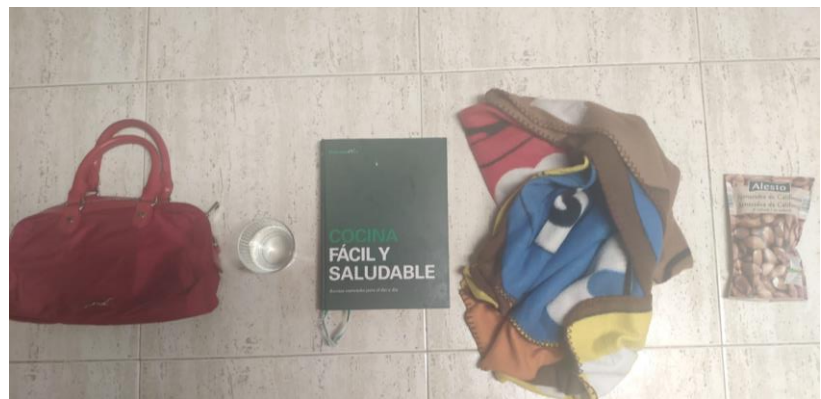
B ossa de mà A igua L ibre M anta A metlles