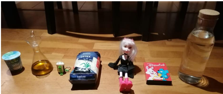
I ogurt O li L ot A rròs N ina D omino A igua