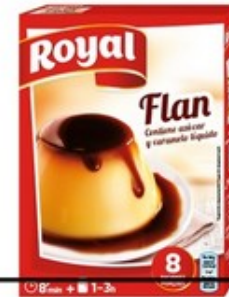
Sobres per fer flam