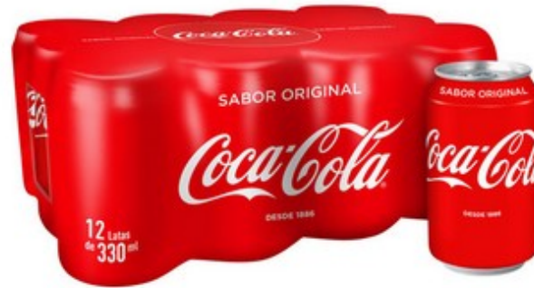
Pack de llaunes 5,5€