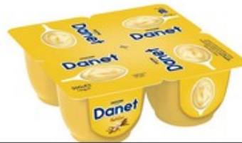
4 Natilles 2€