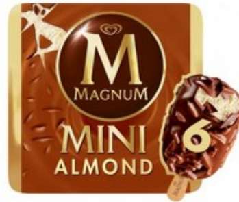
Magnum 5€ capsa