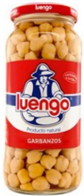
Cigrons 1€ paquet