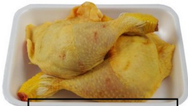
Safata pollastre 5€