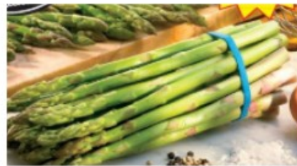
Manat d'espàrrecs 2,5€/kg