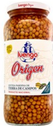
Llenties 1€ paquet