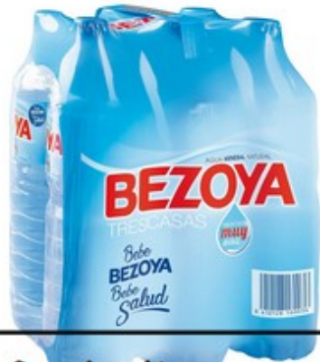
Pack d'aigua 2€