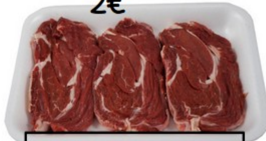
Safata vedella 2,5€