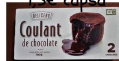
Coulant 3€ capsa