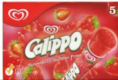
Calippo 4€ capsa