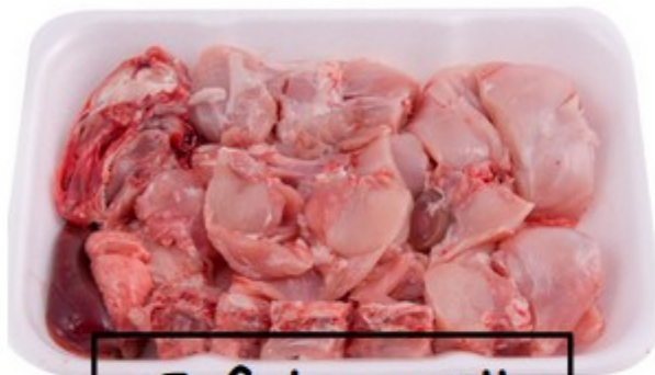
Safata conill 5€