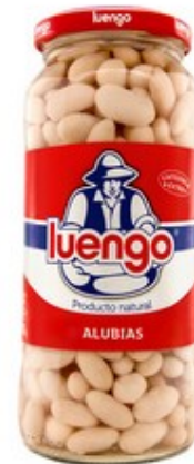
Mongetes 1€ paquet