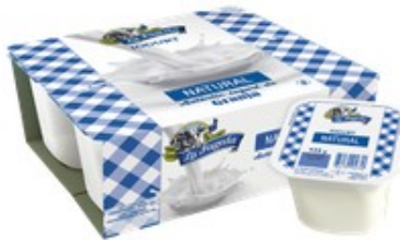
4 iogurts 1,5€