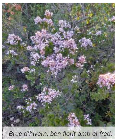
Bruc d'hivern, ben florit amb el fred.