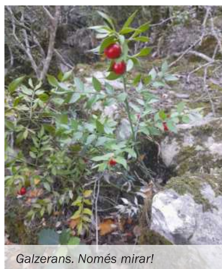
Galzerans. Només mirar!