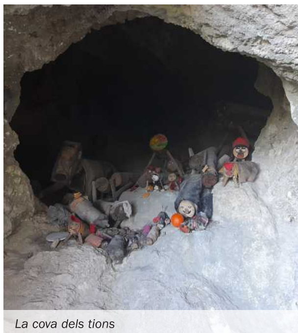
La cova dels tions