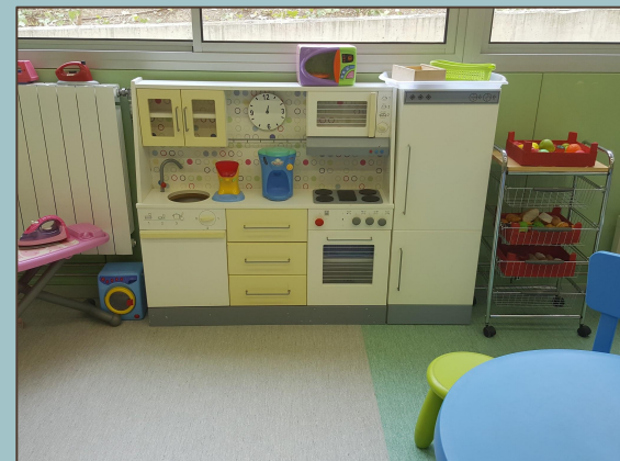
ROLE PLAY (ENGLISH)