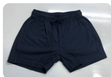
PANTALÓ CURT 6 €