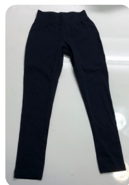
PANTALÓ DE XANDALL SENSE GOMES ALS BAIXOS 10 €