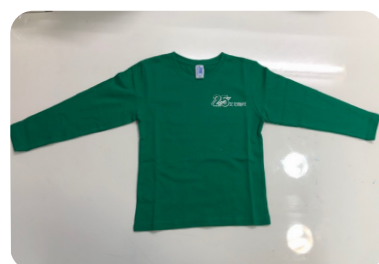
SAMARRETA MÀNIGA LLARGA 5,50 €

TAMBÉ US OFEREIX AQUESTES PECES DE ROBA PER SI HO VOLEU COMPRAR TOT ALLÀ