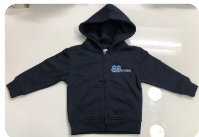
DESSUADORA 15 €