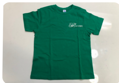
SAMARRETA MÀNIGA CURTA 4,50 €

➡ Aquestes peces de roba les podeu comprar a One&Plus