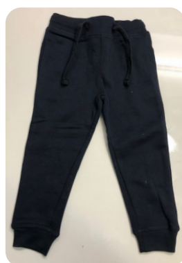
PANTALÓ DE XANDALL 11 €