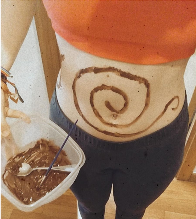
Body painting/Pintura de cos