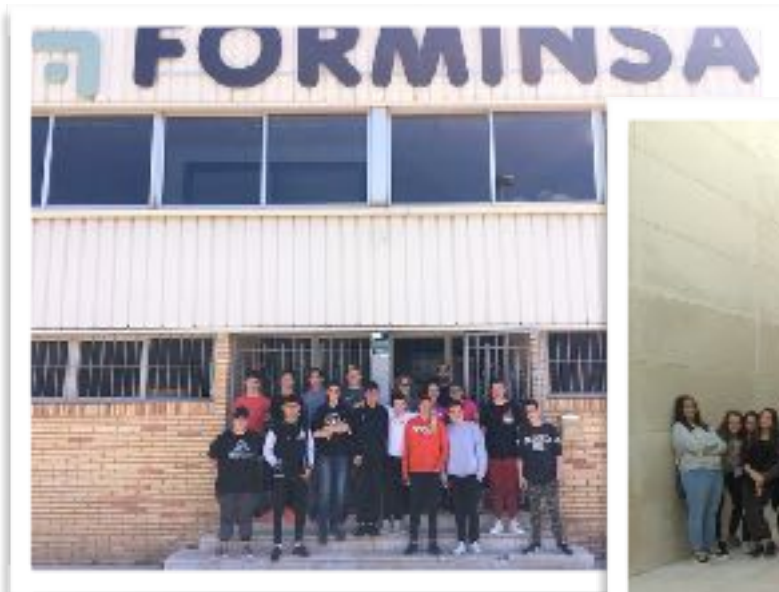
Visita dels alumnes de 4t a Forminsa