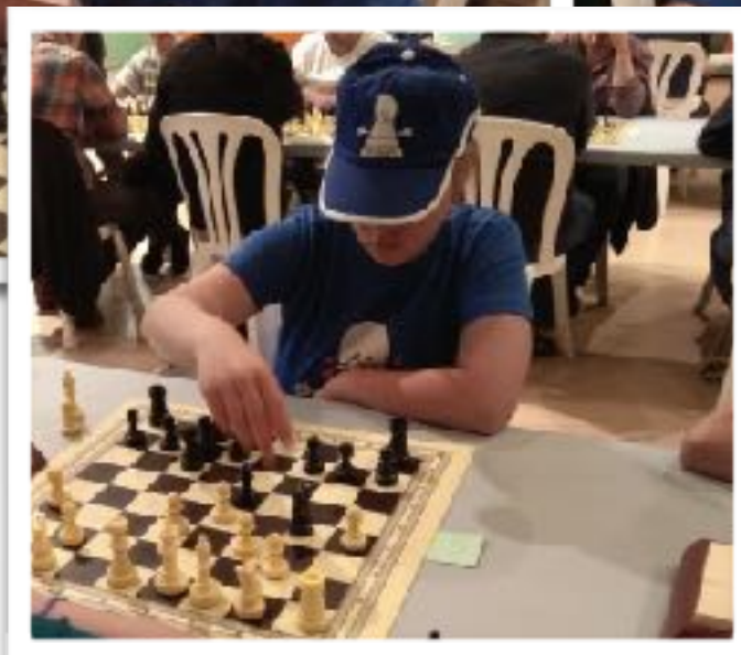
Jugadors de l'extraescolar d' es- cacs en un torneig a Balsareny.