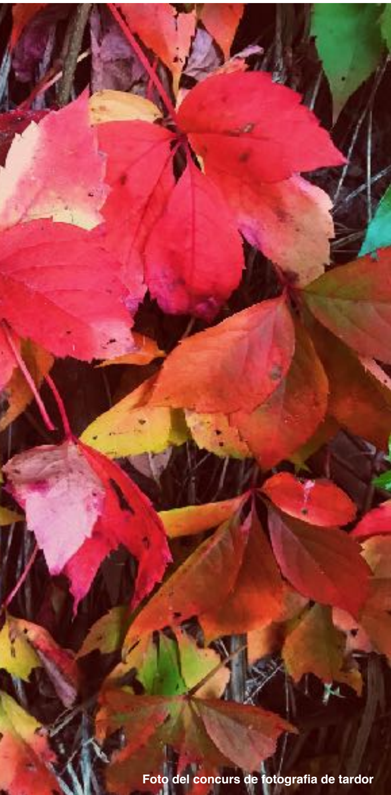
Foto del concurs de fotografia de tardor

Volem salvar el planeta, treure'l de la caixeta. Volem un món millor sense violència ni dolor