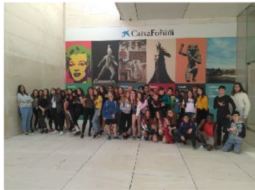
Sortida de 1r i 3r al CaixaForum : Disney i Música Antiga