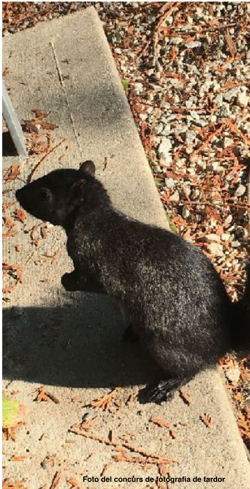
Foto del concurs de fotografia de tardor

Una alma herida, una alma dañada, corre por su vida se escapa de la nada.