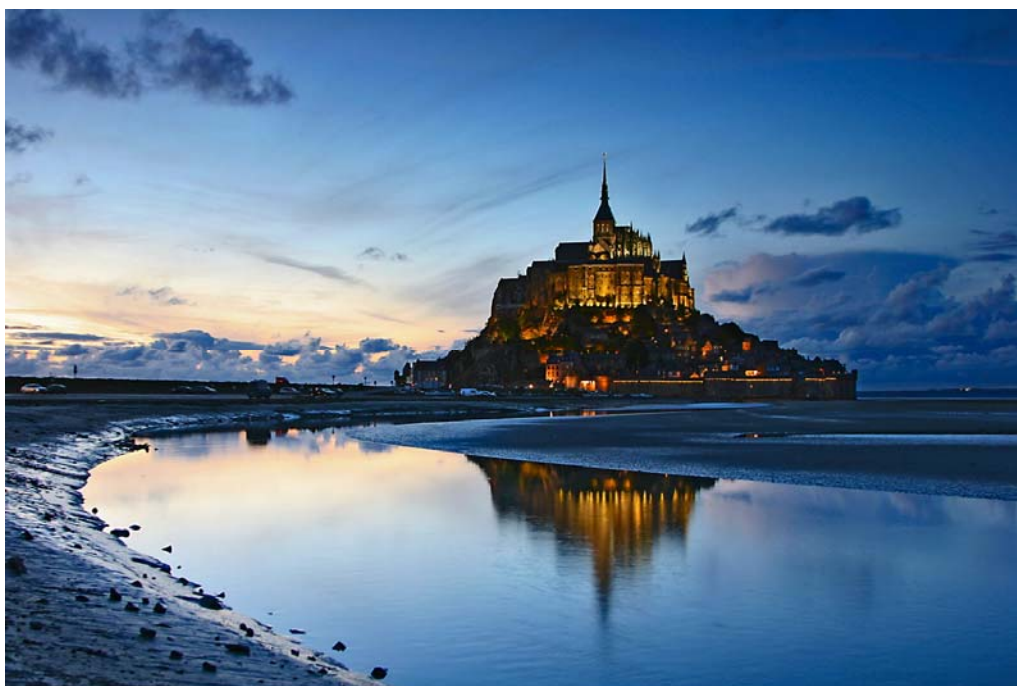
Mont Saint Michel

Tornem a l'hotel de Rennes. Sopar i allotjament.