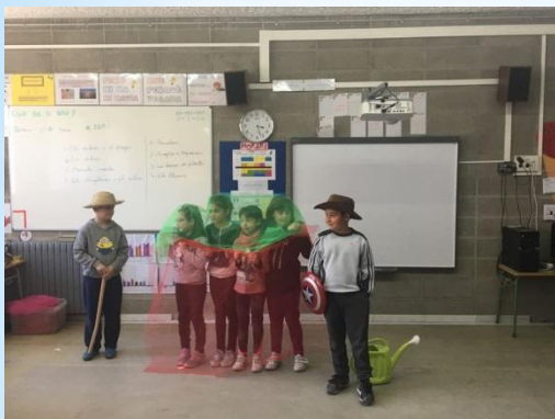
Els arbres i el pagès