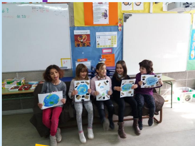
Cuidem el planeta