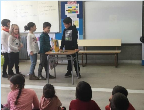
Les bosses de plàstic