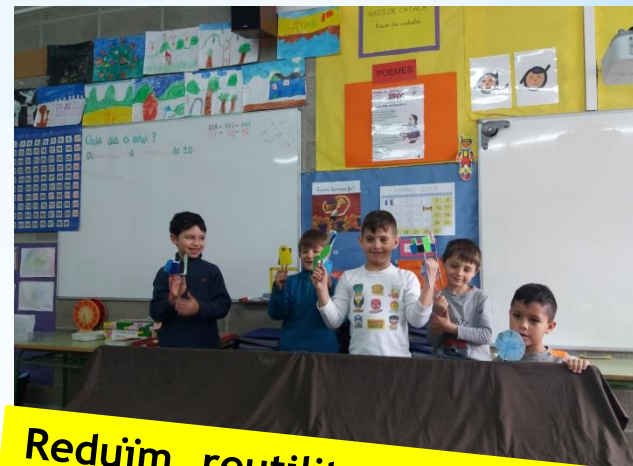
Reduïm, reutilitzem i reciclem