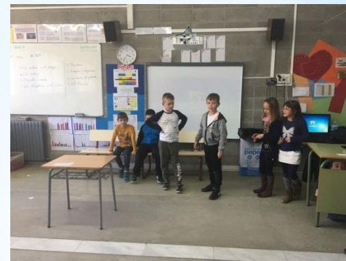
Arreglar i reparar