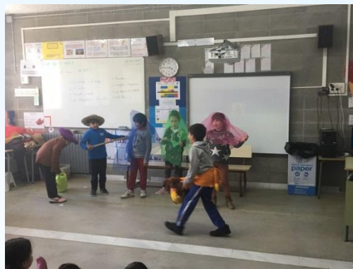
El llenyataire i els arbres