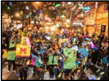
Rua de Carnestoltes