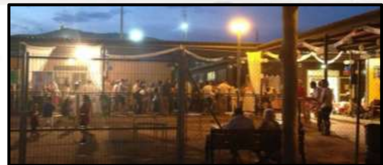
Sopar de Germanor