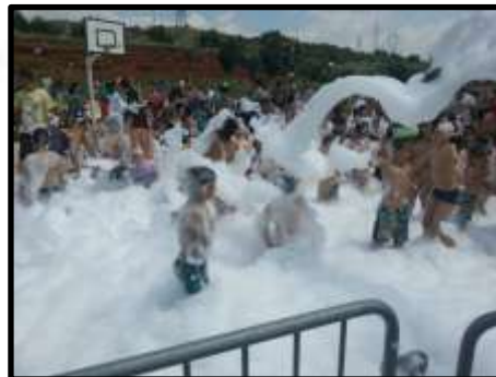
Fi de curs