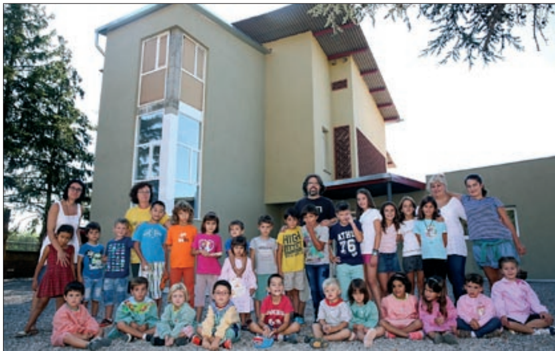
Alumnes i mestres de l'escola de Collsuspina, aquest dilluns al pati del nou edifici

Faltaven pocs minuts per a 2/4 de 9 del matí, aquest dilluns, i a la porta de l'escola de Collsuspina s'hi esperaven la trentena d'alumnes del centre per començar un nou curs. A diferència dels deu anteriors, aquest cop no ho feien als mòduls prefabricats, sinó que s'obrien les portes d'un nou edifici a la finca Els Ventets que suposa una millora per als alumnes i per al municipi. De la trentena d'infants, tres anaven a l'escola per primera vegada –començaven P3– però no hi va haver llàgrimes. Les mestres i el director ensenyaven a primera hora els espais i demanaven als nens si volien que els pares es quedessin una estona. Van decidir que sí, i després de veure el nou espai sortien corrents al pati, molt més gran del que tenien abans.