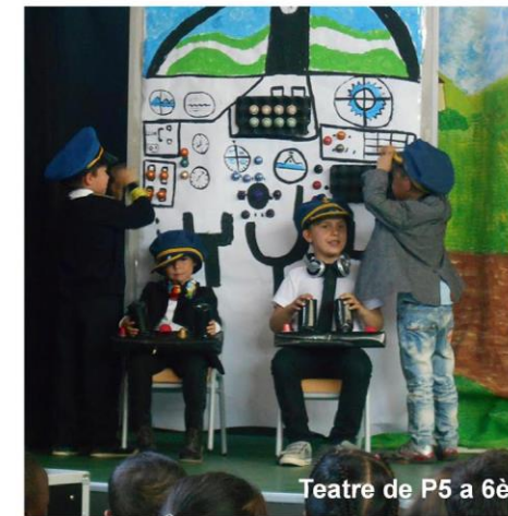
Teatre de P5 a 6è