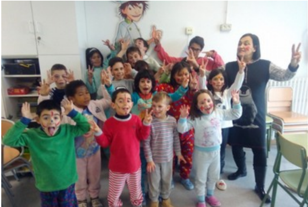
"Un dia a la platja"