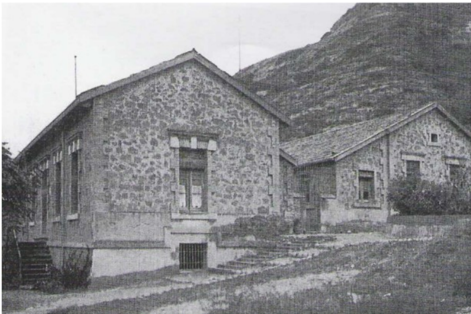
El convent de les monges dominiques i l'escola de nenes. Fotografia extreta de Borgonyà: una colònia industrial del Ter. 1895-1995