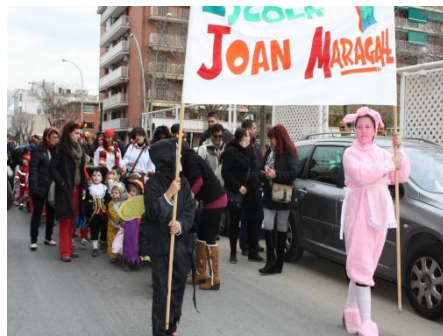
CAR NES TOL TES