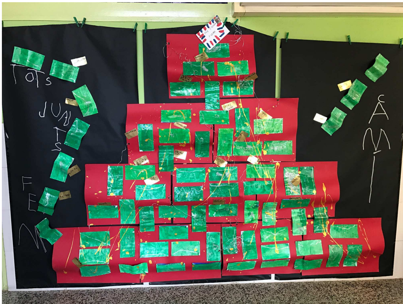
Arbre de Nadal fet pels alumnes de P5