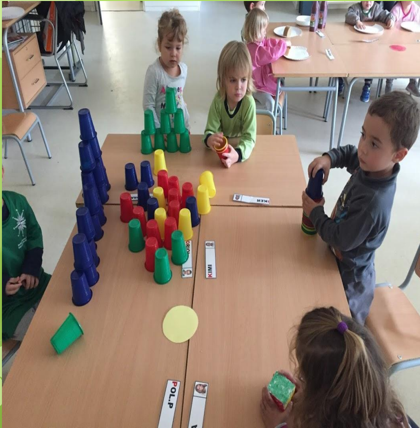
Aprenem i ens divertim