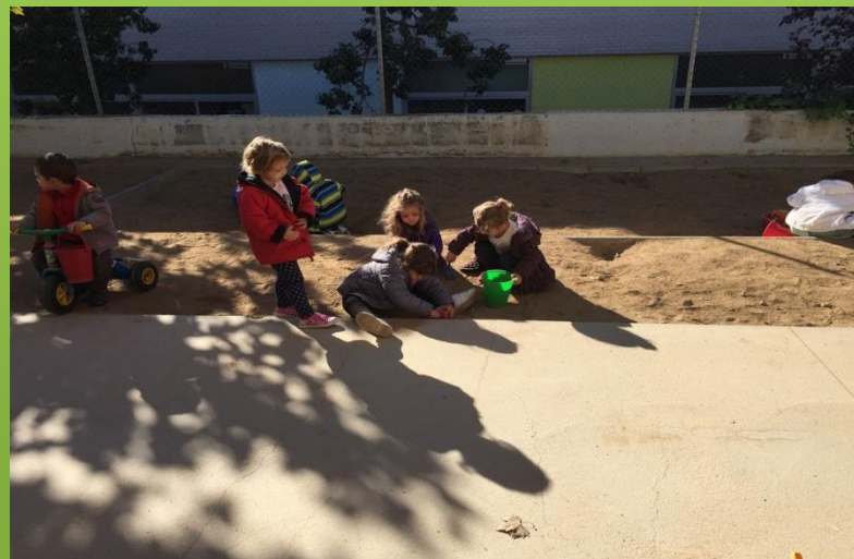
Jugant al pati