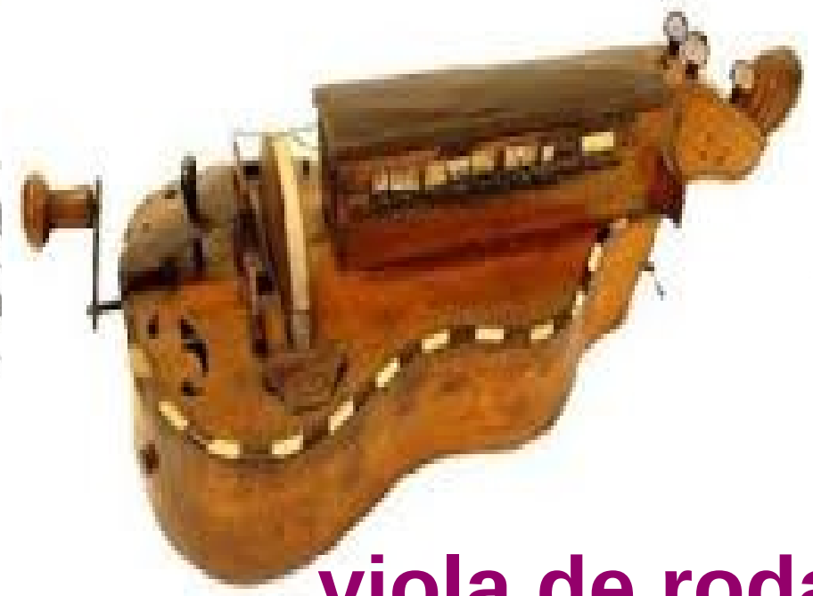
viola de roda