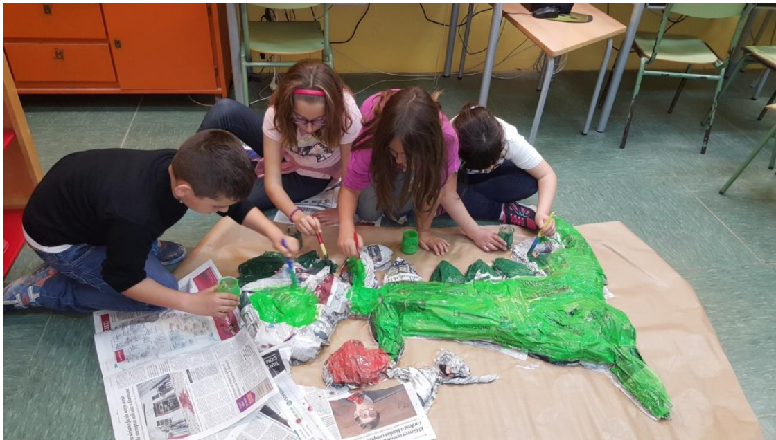
Ens posem a pintar el drac