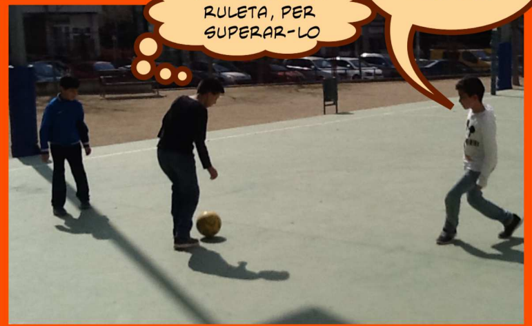
Després de la incidència, el partit es reanuda i torna tota l'emoció del partit